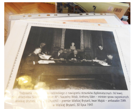
Podpisane przez: Włodzisław Sawicki - prezes RP i Naczelny Wódz, Anthony Eden - minister spraw zagranicznych Wielkiej Brytanii, Winston Churchill - premier Wielkiej Brytanii, Iwan Majski - ambasador ZSRR w Wielkiej Brytanii, 30 lipca 1941