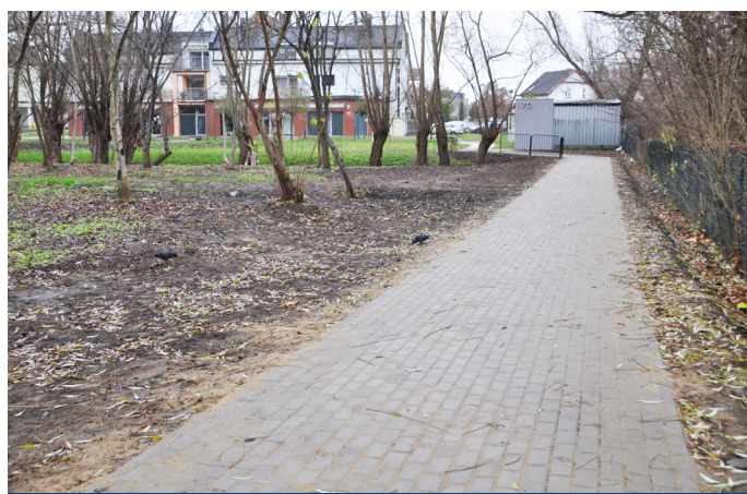
Chodnik w parku prowadzący do Centrum