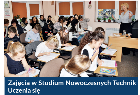
Zajęcia w Studium Nowoczesnych Technic Uczenia się