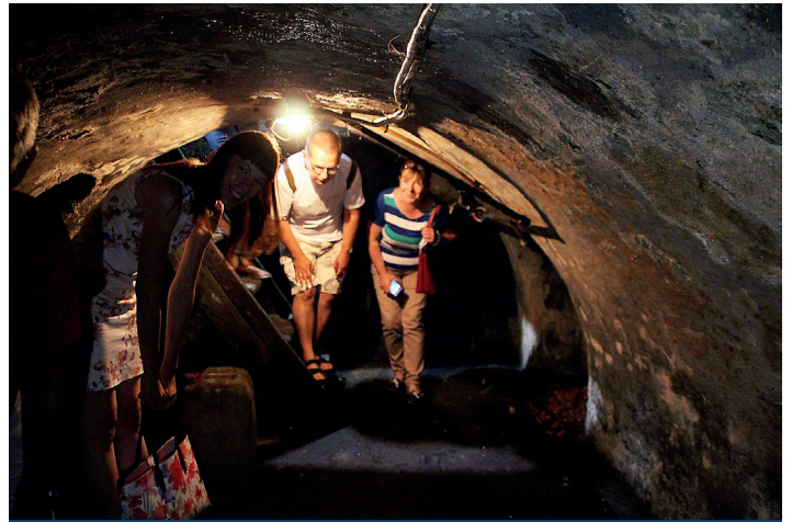
Wizja lokalna odkrytych piwnic

O istnieniu bastei wiemy między innymi z epitafium po żonie komendanta tej budowli znajdującego się właśnie w kościele pw. Podwyższenia Krzyża Świętego. Skoro chroniła śluzę, młyn i folwark, musiała znajdować się w ich sąsiedztwie. Dawne mapy nie są jednak na tyle dokładne, aby bez wątpliwości określić, gdzie znajdował się młyn i folwark. Z pomocą przyszedł przypadek. W czerwcu 2018 roku, podczas budowy ścieżki pieszo-rowerowej z terenu Parku Kulturowego Faktoria do granic miasta Pruszcz Gdański, ciężki sprzęt przypadkiem naruszył strukturę piwnicy, znajdującej się w bezpośrednim sąsiedztwie elektrowni wodnej wybudowanej w 1921 r. i wraz z przynależnymi grunta-