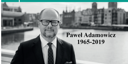
Paweł Adamowicz 1965-2019