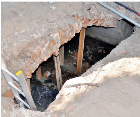
Odstonięcie piwnic podczas prac budowlanych

Kanał i kościół były 559 lat temu tłem coraz popularniejszej w świadomości „Bitwy pod Pruszczem”, która miała miejsce dokładnie 23 sierpnia 1460 roku i stanowiła jeden z epizodów wojny trzy-nastoletniej, toczonej pomiędzy Koroną