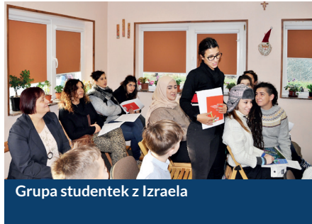
Grupa studentek z Izraela