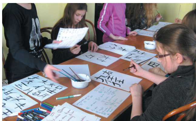
Warsztaty z japońskiej kaligrafii

Zima dobiega końca, a wrażenia ze znakomitej zabawy pozostały. Centrum Kultury i Sportu swoją rzetelną i interesującą ofertą dla dzieci zyskuje sobie grono stałych, młodych bywalców oraz cieszy się zaufaniem rodziców.