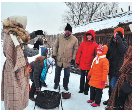
Uczestnicy gry terenowej

Gra terenowa, będąca połączeniem podchodów z konkursem wiedzy o Faktorii i życiu Gotów. Odbywała się na terenie całego obiektu. Uczestnicy po ok. 10 minutowej opowieści o Gotach, osadzie i szlaku bursztynowym odwie-