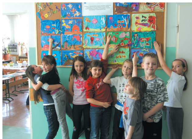
Zajęcia rozwijające zainteresowania uczniów szczególnie uzdolnionych plastycznie w ZS nr 4.

ropejskiego Funduszu Społecznego, priorytet IX Rozwój kształcenia i kompetencji w regionach, działanie 9.1. Wyrównywanie szans edukacyjnych i zapewnienie wysokiej jakości usług edukacyjnych świadczonych w systemie oświaty, poddziałanie 9.1.2. Wyrównywanie szans edukacyjnych i zapewnienie wysokiej jakości usług edukacyjnych świadczonych w systemie oświaty.