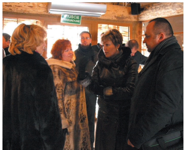
Goście z Kaliningradu

Przedstawiciele samorządów z Obwodu Kaliningradzkiego przyjechali z wizytą do Pruszcza Gdańskiego. Na miejscu odwiedzili znaną, również w tamtych rejonach, Faktorię Rzymską. Wzmoczone zainteresowanie Rosjan to duża zasługa planowanych na czerwiec zmian w małym ruchu granicznym. To bardzo ważna szansa do rozwoju turystyki i biznesu.