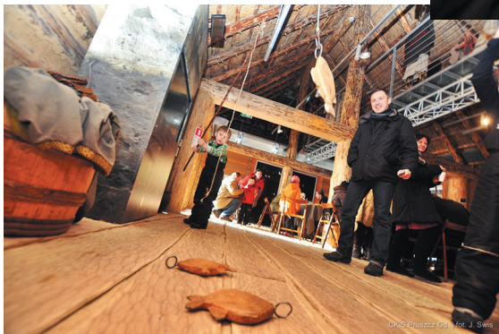
Zajęcia dla dzieci i młodzieży szkolnej

W czasie ferii zimowych, na terenie Faktorii odbyło się 6 zorganizowanych wydarzeń dla dzieci i młodzieży szkolnej: trzykrotnie „Poszukiwanie Skarbu Księżniczki” oraz jednokrotnie: „Graj i Tańcz”, „Zostań Legionistą” i „Sztuka Naskalna i Lepienie Garnków”. Wszystkie zajęcia miały charakter zabaw połączonych z edukacją.