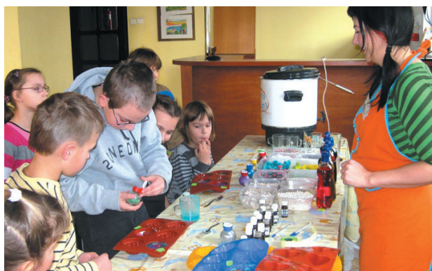
Warsztaty Piany Mydlanej