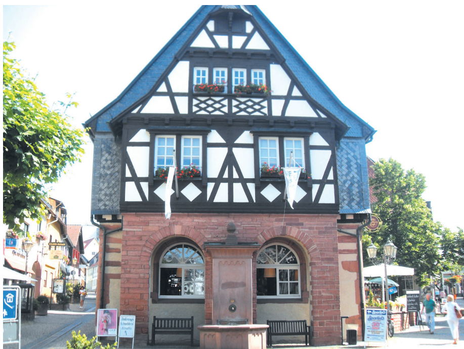
Hofheim am Taunus

owało stworzeniem rozbudowanej sieci międzynarodowych kontaktów. Młodzież z Pruszcza uczestniczy już w innych programach partnerskich, realizowanych przez Hofheim, wraz z historycznym, burgundzkim miastem Chinon oraz brytyjskim Tiverton.