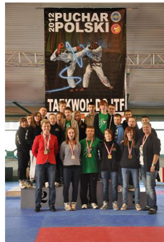
Uczestnicy zawodów Pucharu Polski Taekwon-do

Warto zaznaczyć, że zawodnicy startujący w kategorii wiekowej junior są jeszcze juniorami młodszymi, a już nawiązują wyrównaną walkę z kolegami starszymi od siebie (junior 17,18 lat, junior młodszy to 14,15,16 lat).