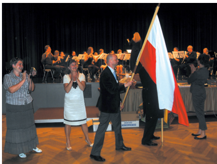
Wizyta w Hofheim

Zawarcie dokumentu partnerstwa to oficjalne przypieczętowanie współpracy, która rozwijała się od 2009 roku. Pracujemy razem nie tylko na płaszczyźnie samorządowej, ale