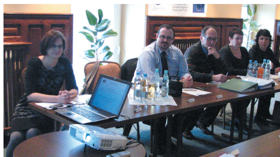
Spotkanie partnerskie w Pruszczu Gdańskim

Na pierwszym spotkaniu partnerskim omawiano plan działań na następne trzy lata, gdyż taki jest okres trwania projektu. Naszym celem jest zintensyfikowanie dialogu kulturalnego i zaangażowanie społeczności lokalnych w działania transgraniczne, jak również zwiększenie atrakcyjności naszego regionu.