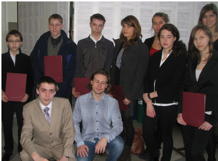
Laureaci stypendiów Burmistrza

Stypendia, w wysokości 100 lub 150 zł miesięcznie, przyznane zostały za wyniki w nauce lub osiągnięcia sportowe dla uczniów będących stałymi mieszkańcami Pruszcza Gdańskiego na okres II semestru roku szkolnego 2011/2012. Otrzymało je 14 osób.