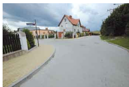
Zakończony remont ul. Sportowej