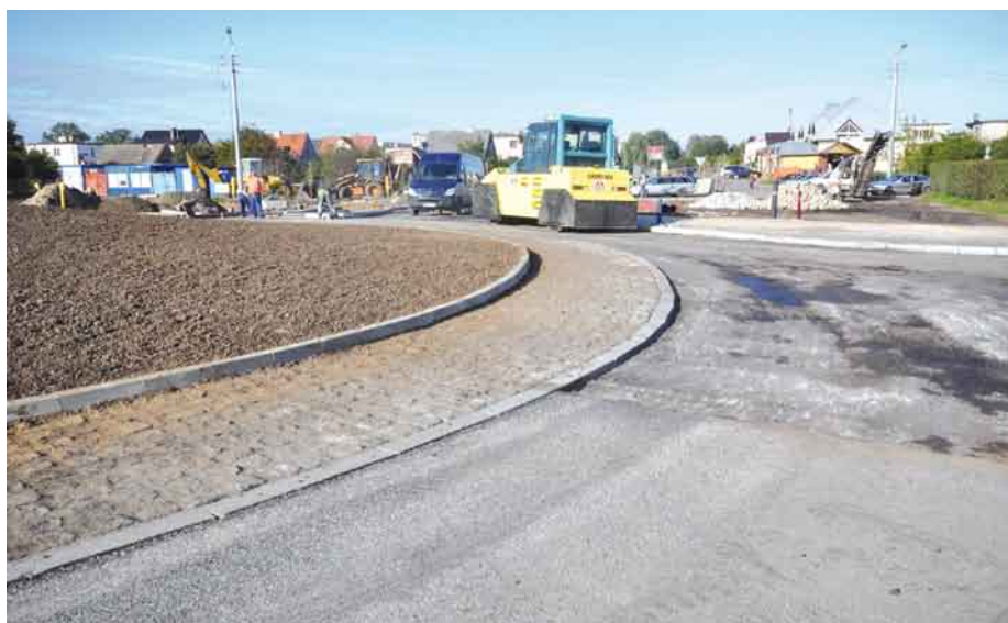
Nowa nawierzchnia bitumiczna - ul. Emilii Plater