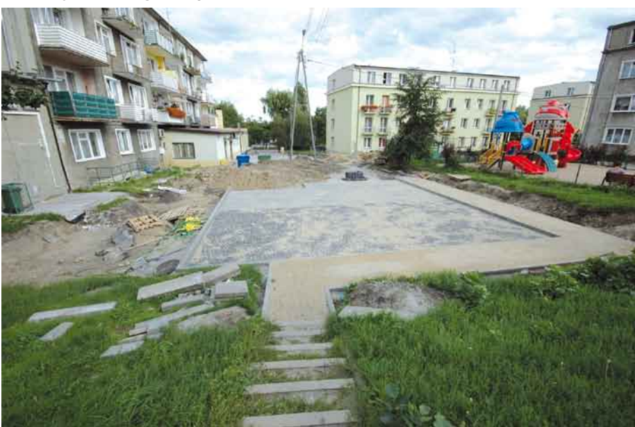
ul.1 Maja w trakcie remontu