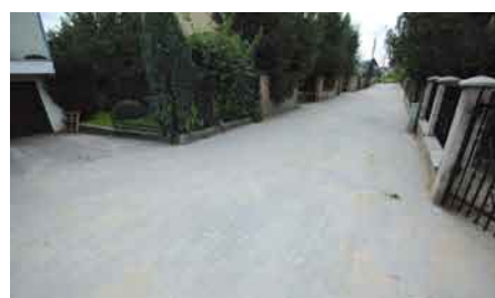
Nowa ul. Traugutta