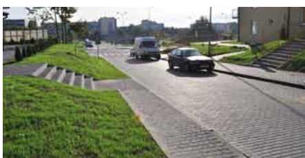
Zakończone prace przy ul. Cyprysowej