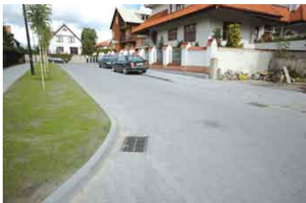
ul. 3 Maja oraz Pogodna po remoncie