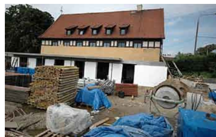
Rozbudowa budynku CKiS