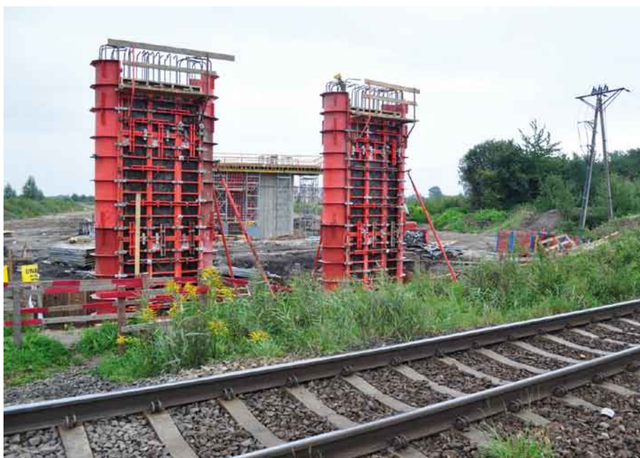
Obwodnica Miasta – betonowanie podpór wiaduktu

W ostatnich tygodniach w naszym mieście rozpoczęto, lub zakończono kilkanaście kolejnych inwestycji. Każda z nich to kolejny krok, podnoszący jakość życia w Pruszczu Gdańskim.