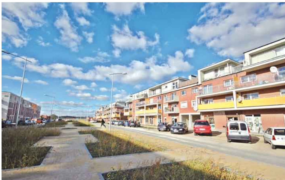
Osiedle Strzeleckiego - ul. Hryniewieckiego