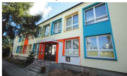
Remont elewacji przedszkola nr 3