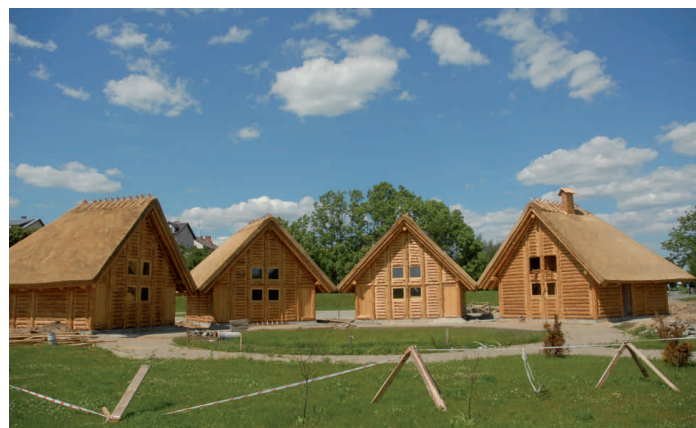
Międzynarodowy Bałtycki Park Kulturowy Faktoria