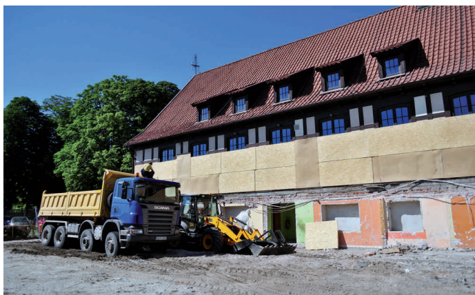
Rozbudowa Centrum Kultury i Sportu