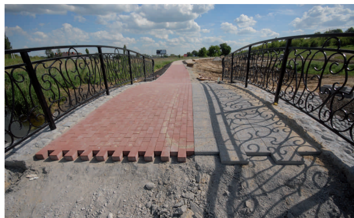
Nowa ścieżka rowerowa w kierunku Gdańska