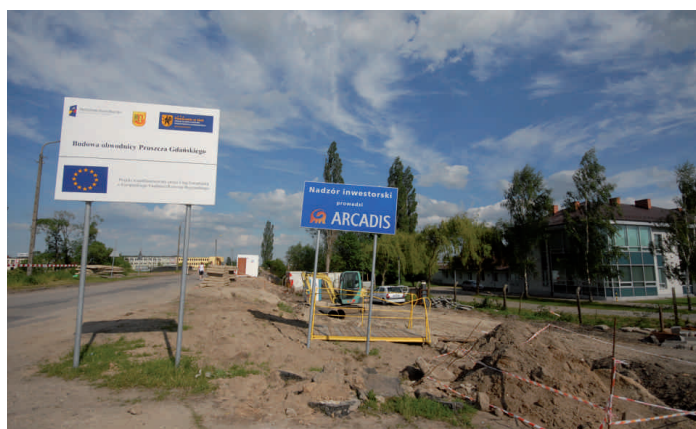
Budowa obwodnicy Pruszcza Gdańskiego