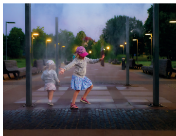
I miejsce: Jarosław Semrau