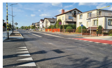
Zakończenie II etapu prac na ul. Gałczyńskiego.