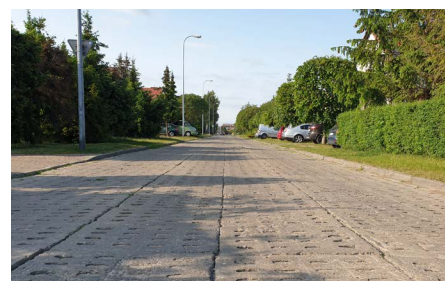
Planowana przebudowa ul. Reymonta.