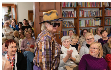
Figura o filmie, teatrze i swoich kreacjach aktorskich

Katarzyna Figura – gwiazda kina, teatru i telewizji, odwiedziła 6 maja 2023 r. Pruszcz Gdański na zaproszenie Powiatowej i Miejskiej Biblioteki Publicznej. Jak nietrudno się domyślić wizyta aktorki przyciągnęła do biblioteki tłumy wielbicieli. Spotkanie poprowadził Krystian Nehrebecki.