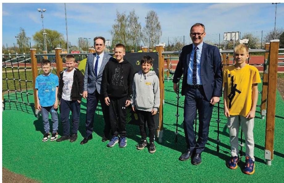
Otwarta strefa aktywności „Linarium” przy Szkole Podstawowej nr 4.

wierzchni. Na nowe linarium składają się: obiekty linowe, ścianki wspinaczkowe, drabinki, belki balansujące oraz urządzenia równoważne. Wszystkie elementy przeznaczone są dla dzieci w wieku od 3 do 12 lat. Miasto zawarło także umowę na zagospodarowanie terenu rekreacyjnego przy ul. Olszewskiego w Pruszczu Gdańskim. Zakończenie prac planowane jest na sierpień 2023 r. Zakres prac obejmuje budowę ciągów pieszych, schodów terenowych, ścieżki dla rolkarzy, boiska wielofunkcyjnego, placów zabaw, wybiegów dla psów, strefy fitness, terenów zielonych, wodociągu oraz oświetlenia.