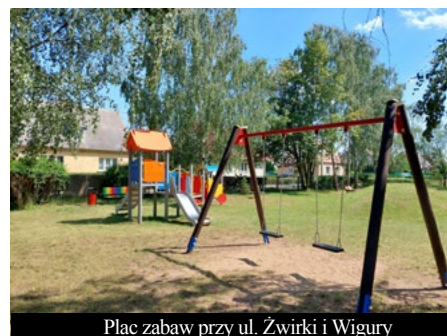
Plac zabaw przy ul. Żwirki i Wigury