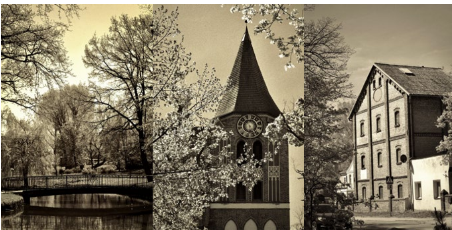
III miejsce: Bartłomiej Szymerski