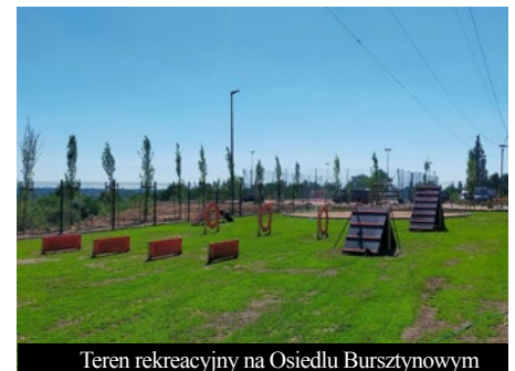
Teren rekreacyjny na Osiedlu Bursztynowym