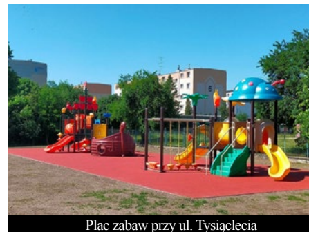
Plac zabaw przy ul. Tysiąclecia

Takiego terenu rekreacyjnego jeszcze w Pruszczu Gdańskim nie było! Przy ulicy Rogozińskiego możemy korzystać między innymi z nowoczesnego parku dla psów, toru rolkarskiego, siłowni, i parku fitness, boiska wielofunkcyjnego, stołów do ping-ponga i placu zabaw dla starszych i młodszych dzieci. Nie zapomniano także o miejscach parkingowych. Nowe place zabaw powstały także przy budynku oddziałów przedszkolnych ZSO nr 1, przy ulicy Żwirki i Wigury i przy budynku oddziałów przedszkolnych SP nr 2 przy ulicy Tysiąclecia.