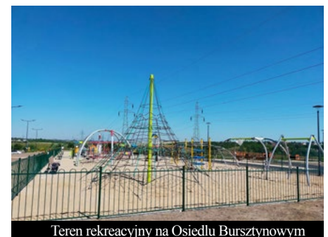
Teren rekreacyjny na Osiedlu Bursztynowym