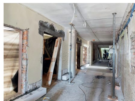
Przebudowa w Szkole Podstawowej nr 4