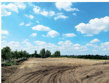
Trwające prace na terenie nowego cmentarza