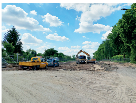
Przebudowa ul. Spokojnej