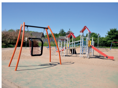
Plac zabaw w Międzynarodowym Bałtyckim Parku Kulturowym Faktoria

Obecnie trwają również prace na terenie dawnego cmentarza katolickiego między ulicami Wita Stwosza i Grota Roweckiego. Pojawiły się tam już pierwsze chodniki oraz wymieniono nawierzchnię jednego z parkingów. Całość inwestycji dopełni odtworzona główna aleja parku oraz ławki. W centralnej części parku natomiast ustawiony zostanie pomnik upamiętniający 80. rocznicę Zbrodni Katyńskiej.