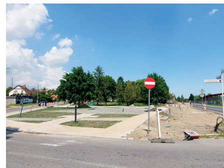
Trwające prace w parku przy ul. Wita Stwosza

będzie poddany renowacji i nadal na tym odcinku drogi będzie występowała nawierzchnia asfaltowa.