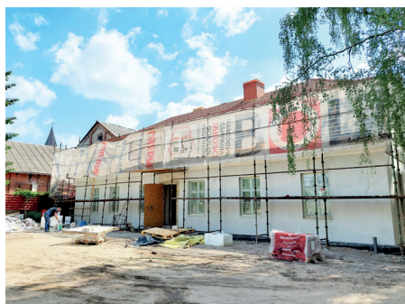
Trwające prace przy Wojska Polskiego 44