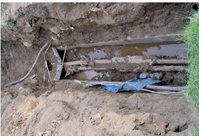
Sieć ciepłownicza – dawniej

Wszystkie te działania są po to, by żyć w zgodzie z przyrodą. Doceniając jej wysiłki w dbaniu o nasz komfort życia, odwiedzajmy się tym samym każdego dnia. Szanujmy ją, wspierajmy i pozostawmy naszym dzieciom w jak najlepszym stanie.