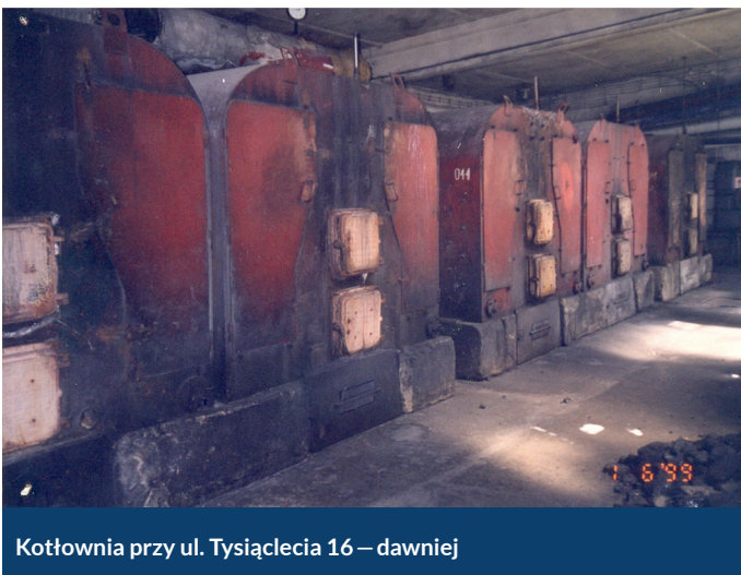
Kotłownia przy ul. Tysiąclecia 16 – dawniej

dzieje w obszarze ochrony przyrody. Jej zasoby mają ogromne znaczenie dla naszego życia. I nie tylko wypada o nie dbać, ale naszym obowiązkiem jest się o nie troszczyć.