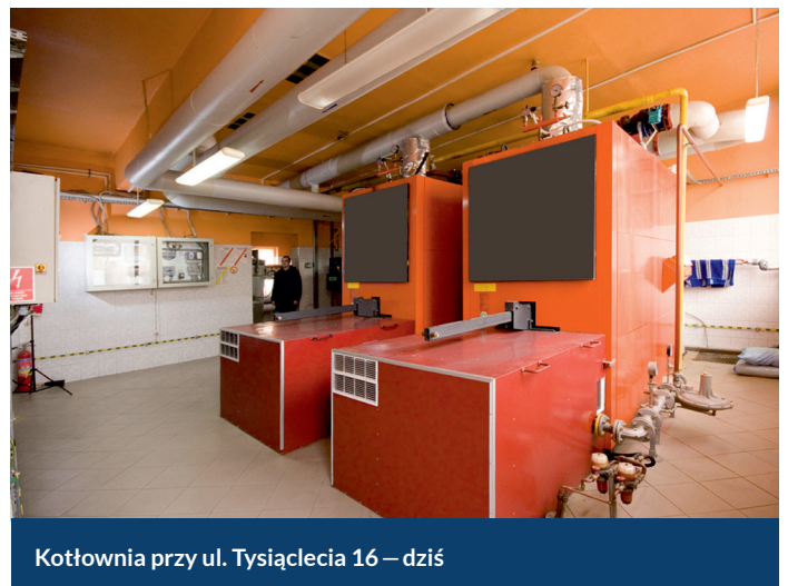
Kotłownia przy ul. Tysiąclecia 16 – dziś