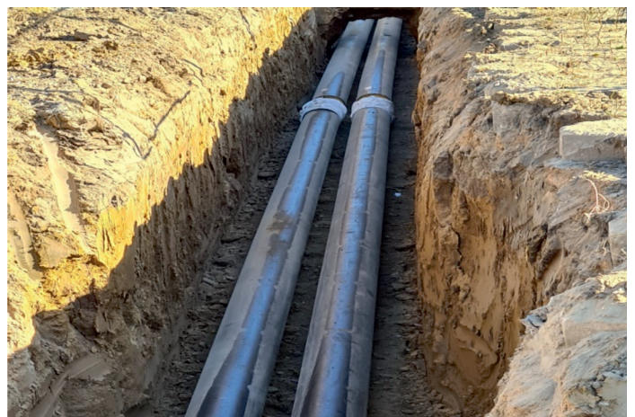
Sieć ciepłownicza – dziś