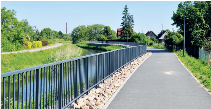
Ścieżka pieszo-rowerowa przy Strudze Gęś

W tych miejscach mieszkańcy już teraz mogą zostawić rower lub samochód i wyruszyć w dalszą podróż pociągiem. Na parkingach typu Park & Ride powstało ponad 200 miejsc parkingowych i ponad 150 miejsc postojowych dla rowerów. Dzięki temu rozwiązaniu mieszkańcy Pruszcza Gdańskiego oraz Powiatu Gdańskiego mogą szybciej dojeżdżać do pracy w Trójmieście. Osoba dojeżdżająca codziennie pociągiem z Pszczółek do Gdańska i z powrotem oszczędza 11 dni (tyle rocznie stoi w korku) oraz 7 000 zł w skali roku.