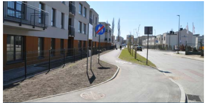
Ciąg pieszo-rowerowy ul. Olszewskiego

Na projekt składają się 3 węzły transportowe na terenie powiatu gdańskiego, obejmujące budowę i przebudowę infrastruktury drogowej (dróg, chodników, ścieżek rowerowych, miejsc parkingowych). W projekcie zaplanowano realizację 23 zadań inwestycyjnych z czego 12 zadań dotyczy Miasta Pruszcz Gdański m.in.: budowa parkingu przy ul. Dworcowej typu Park & Ride dla samochodów osobowych i rowerów oraz budowa ścieżek rowerowych i pieszo – rowerowych w różnych częściach miasta. Pozostałe inwestycje realizowane są przez samorządy partnerskie: Gminę Pszczółki, Gminę Pruszcz Gdański, Powiat Gdański oraz Gminę Trąbki Wielkie.