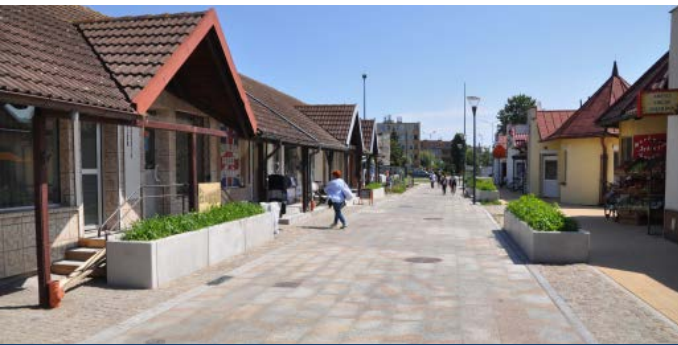
Deptak od ulicy Skalskiego do dworca PKP

Węzły integracyjne to największy z projektów na jaki udało się pozyskać środki unijne w 2017 roku. Jesteśmy liderem przedsięwzięcia, realizowanego na terenie 5 samorządów: Gminy Miejskiej Pruszcz Gdański, Gminy Pruszcz Gdański, Gminy Pszczółki, Gminy Trąbki Wielkie oraz Powiatu Gdańskiego. Wartość całego projektu wynosi ponad 41 mln zł. Dofinansowanie z Unii Europejskiej wynosi blisko 25 mln zł.