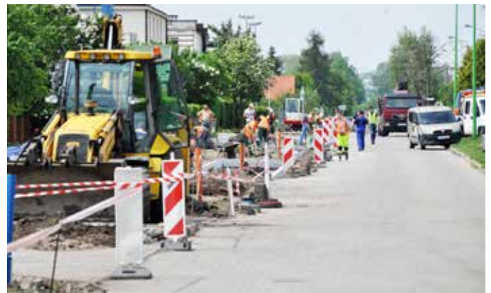
Chodnik przy ul. Modrzewskiego