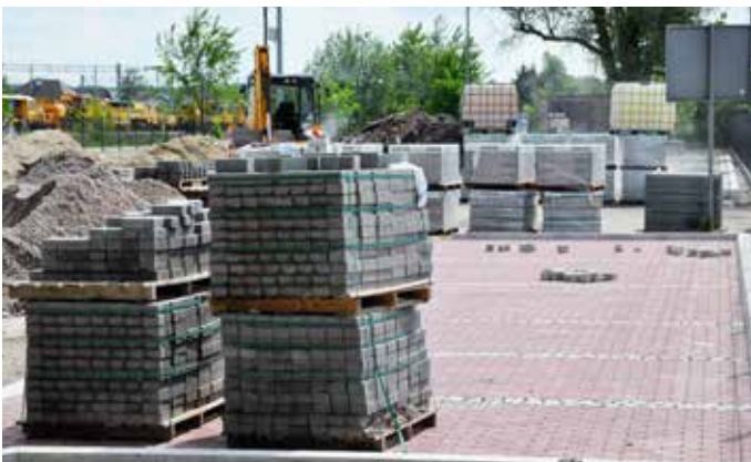
Park & Ride przy ul. Dworcowej