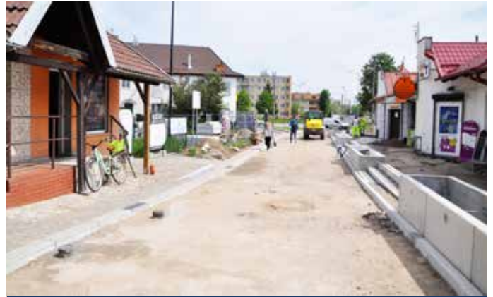
Ciąg pieszo-rowerowy przy Dworcu PKP