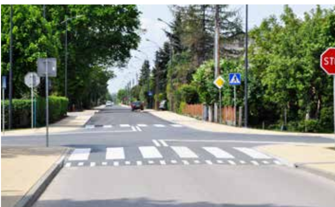
Ul. Słowackiego (inwestycja powiatowa dofinansowana przez miasto)