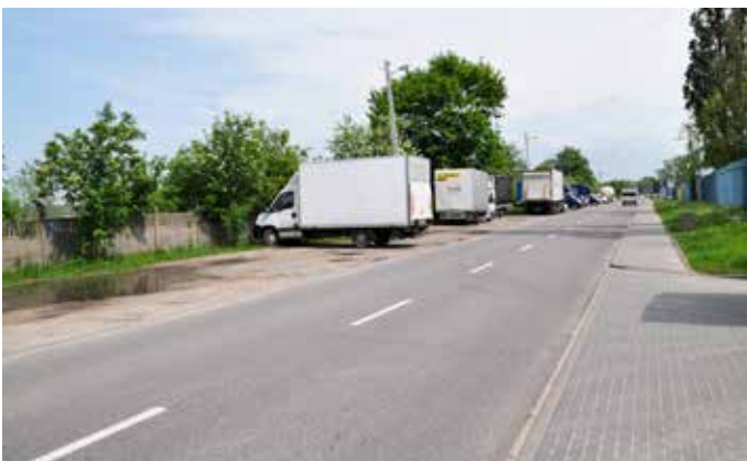
Ul. Sikorskiego – przed budową parkingu