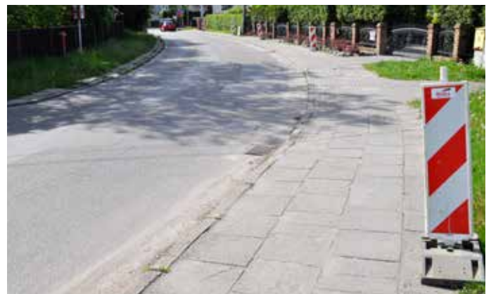
Ul. Sienkiewicza – przed budową chodnika