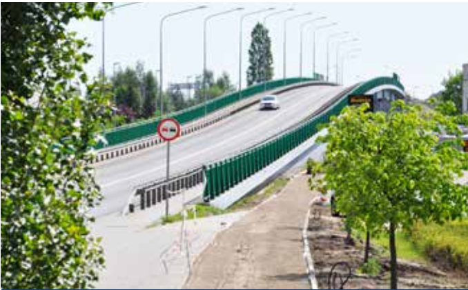
Ścieżka rowerowa przy ul. Przemysłowej