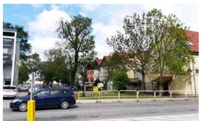
Skrzyżowanie ul. Grunwaldzkiej z ul. Chopina po wyburzeniu pawilonu handlowego