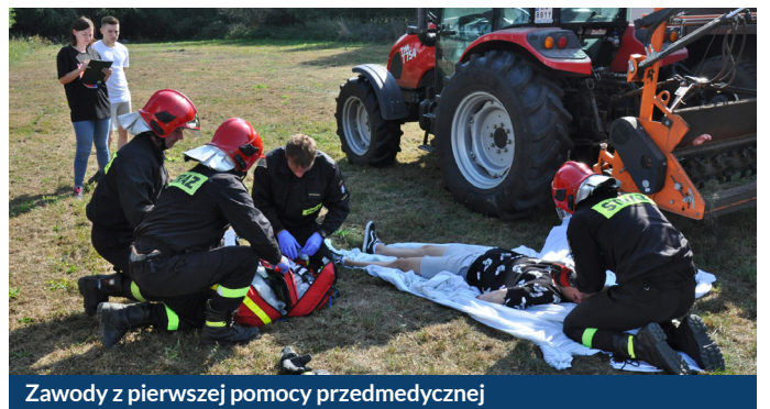
Zawody z pierwszej pomocy przedmedycznej

Mistrzostwa powiatu gdańskiego w udzielaniu pierwszej pomocy zgromadziły 9 drużyn. Najpierw był test wiedzy, a potem zadania praktyczne w terenie. Nagrodzone zostały 4 najlepsze drużyny: I miejsce: KP PSP Pruszcz Gdański