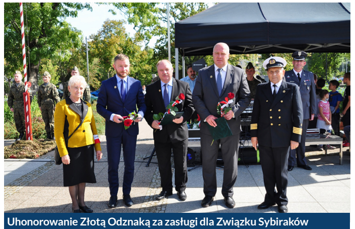
Uehonorowanie Złotą Odznaką za zasługi dla Związku Sybiraków