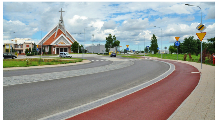
ul. Emilii Plater