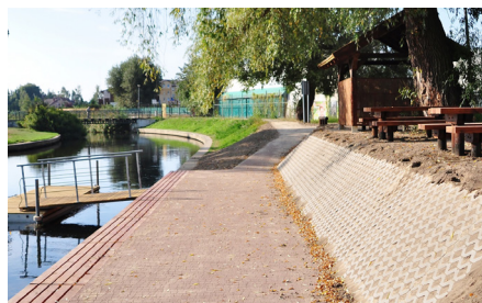
Przystań kajakowa przy CKiS

nagrodzony przez Urząd Marszałkowski Województwa Pomorskiego – Park z Gruszą.