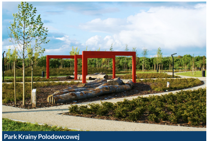
Park Krainy Połudowcowej