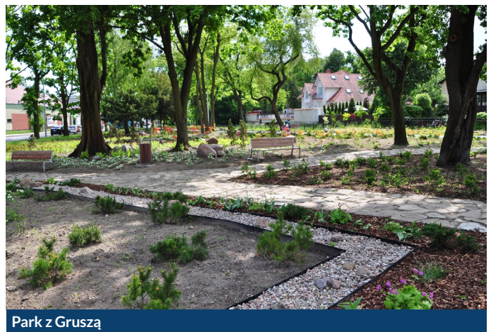
Park z Gruszą