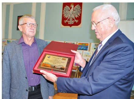
Wręczenie pamiątkowej tabliczki oraz medali z okazji 30-lecia działalności Wojskowego Koła Wędkarskiego „Czapla”

społeczną straż rybacką. Kontrolujemy jakość wód, walczymy z kłusownictwem. W ramach akcji zarybiania, członkowie „Czapli” w 2017 roku wypuścili ponad 180 000 rybek. W tym