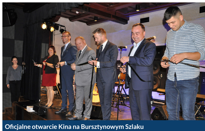
Oficjalne otwarcie Kina na Bursztynowym Szlaku

Pełny repertuar kina dostępny jest na stronie: kino.ckis-pruszcz.pl .