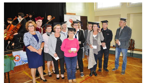
Nowi słuchacze UTW