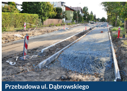
Przebudowa ul. Dąbrowskiego

Staszica, Konopnickiej, Głowackiego, Czekanowskiego, Domeyki i wiele innych. W trakcie jest przebudowa ulic: Dąbrowskiego, Olszewskiego, Wróblewskiego.