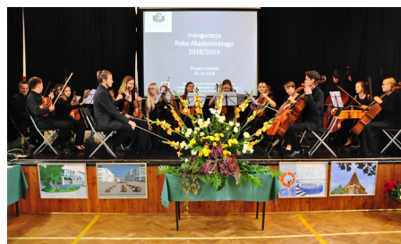
Koncert Orkiestry Akademii Muzycznej