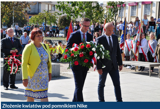
Złożenie kwiatów pod pomnikiem Nike