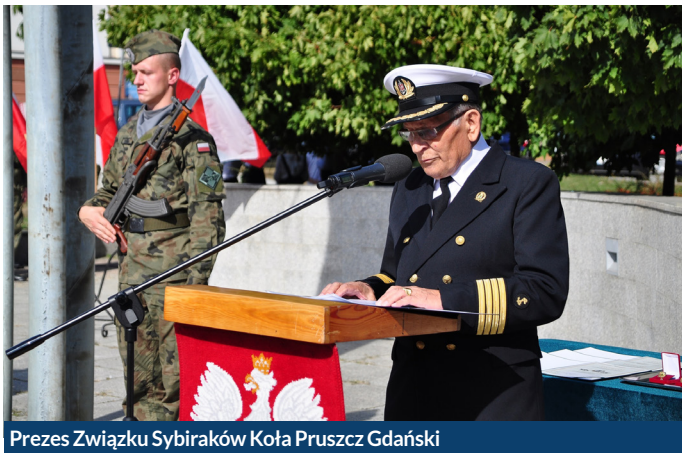
Prezes Związku Sybiraków Koła Pruszcz Gdański

Po oficjalnych uroczystościach odbyło się spotkanie Sybiraków i zaproszonych gości w sali posiedzeń Urzędu Miasta Pruszcz Gdański.