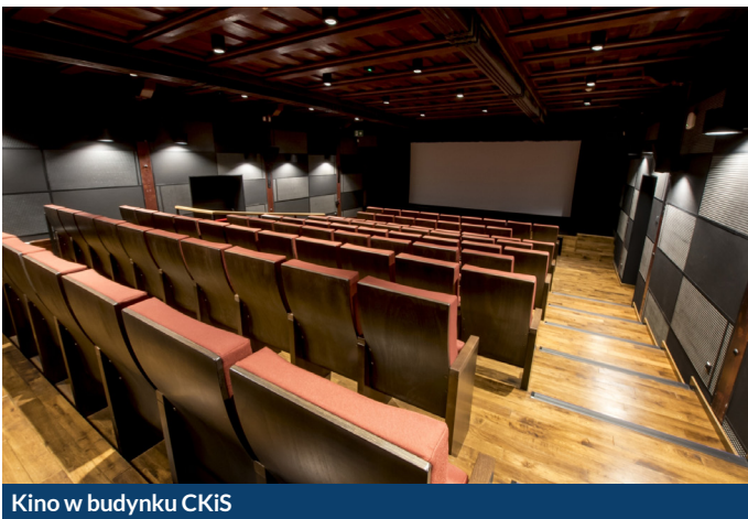
Kino w budynku CKiS