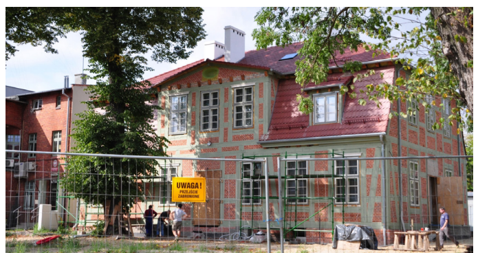
Budynek przy ul. Krótkiej 6