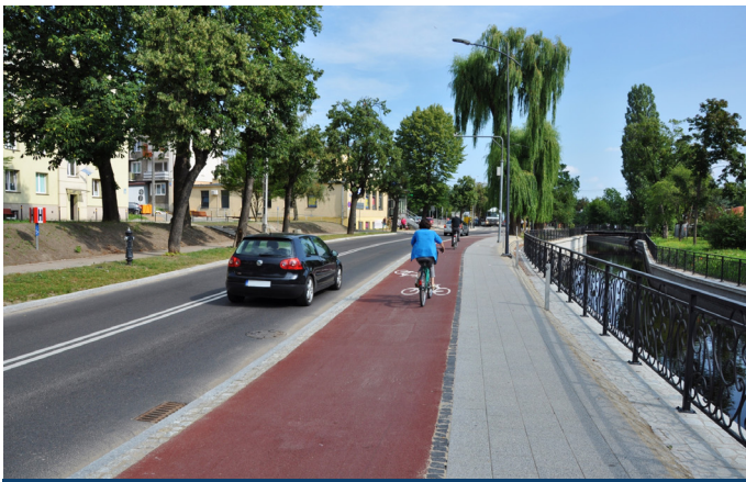
ul. Wojska Polskiego