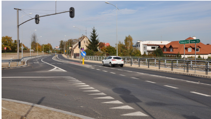
Skrzyżowanie ul. Grunwaldzkiej z ul. Raciborskiego

Inwestycja zrealizowana wspólnie z Generalną Dyрекcją Dróg Krajowych i Autostrad oraz Starostwem Powiatowym