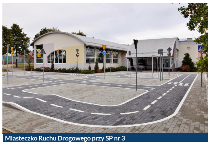
Miasteczko Ruchu Drogowego przy SP nr 3