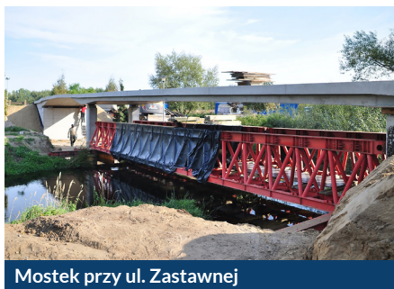
Mostek przy ul. Zastawnej

Zbudowaliśmy nowe parkingi, place zabaw, a także przeprowadziliśmy kompleksowy program remontów i budowy nowych mostków na rzece Raduni i Kanale Raduni.