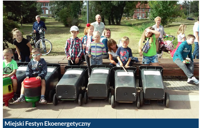
Miejski Festyn Ekoenergetyczny

Serdecznie dziękujemy wszystkim wystawcom, naszym mieszkańcom młodszym i starszym oraz wszystkim tym, którzy przyczynili się do współtworzenia tej edukacyjnej imprezy!