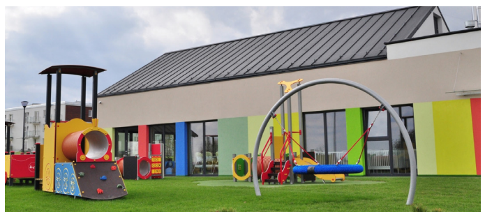
Miejski żłobek przy ul. Romera

Inwestycje zrealizowane przez Miasto Pruszcz Gdański