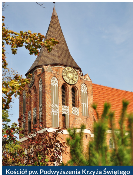
Kościół pw. Podwyższenia Krzyża Świętego

Remontujemy zabytki. Wizerunek centrum miasta odmienił pięknie wyremontowany dwór podcieniowy przy Krótkiej 6. Sensacją stały się zaś maswerki, które wróciły na systematycznie remontowany m.in. z miejskich dotacji kościół pw. Podwyższenia