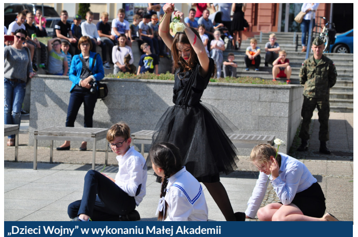
„Dzieci Wojny” w wykonaniu Małej Akademii