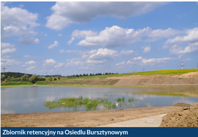
Zbiornik retencyjny na Osiedlu Bursztynowym