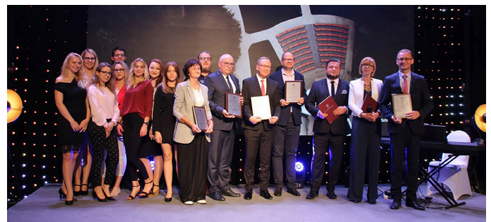
Gala wręczenia wyróżnienia w prestiżowym konkursie „Najlepsza Przestrzeń Publiczna Województwa Pomorskiego 2018”