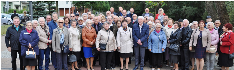
Uroczyste odsłonięcie pamiątkowej ławki dla „diamentowych” i „złotych” par małżeńskich

Ławeczka jest dedykowana parom, które przeżyły we wzajemnym poszanowaniu wiele lat i są przykładem, że udany związek należy budować na wyrozumiałości, akceptacji i sile miłości.