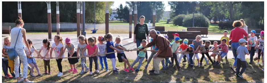
Dzień Przedszkolaka w Pruszczu Gdańskim