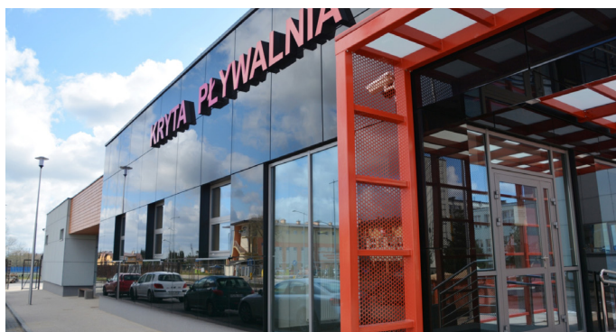
Kryta pływalnia przy SP nr 4