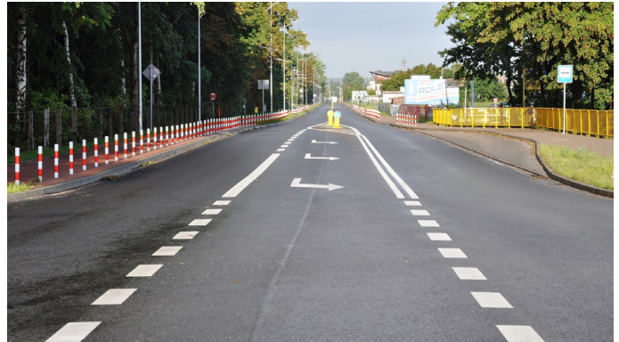
ul. Powstańców Warszawy

Inwestycja zrealizowana wspólnie z Zarządem Dróg Wojewódzkich