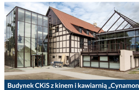
Budynek CKiS z kinem i kawiarnią „Cynamon”

Ukryte dotąd walory zabytkowe obiektu podkreślił także remont remizy strażackiej, która teraz jest nie tylko ładniejsza, ale także lepiej będzie służyć naszym strażakom. Zatrzymajmy się w tym miejscu także przy sąsiadującym ze strażnicą budynkiem CKiS.