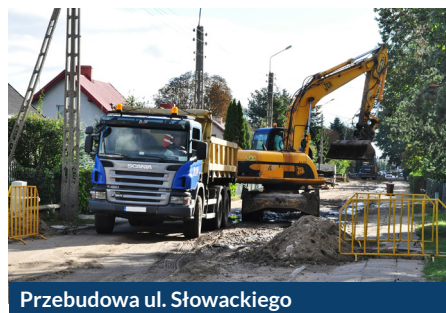
Przebudowa ul. Słowackiego

Przez cztery lata zbudowaliśmy lub przebudowaliśmy ponad 40 dróg, wśród nich kilka najważniejszych ciągów komunikacyjnych. Dzięki współpracy ze Starostwem Powiatowym, powstała ulica Emilii Plater, która stworzyła alternatywne połączenie pomiędzy ulicami Powstańców Warszawy i Kopernika. Zmodernizowaliśmy ulicę Korzeniowskiego i rozpoczęliśmy budowę ulicy Słowackiego. Obecna kadencja to także zakończona sukcesem przebudowa ulicy Powstańców Warszawy. To zadanie realizowaliśmy wraz z Zarządem Dróg Wojewódzkich. Wspólnie z Generalną Dyрекcją Dróg Krajowych i Autostrad oraz Starostwem Powiatowym przebudowaliśmy newralgiczne skrzyżowanie ulic Grunwaldzkiej i Raciborskiego.