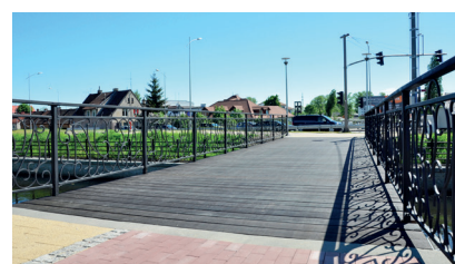
Nowa kładka na Kanale Raduni

N a Kanale Raduni, tuż koło mostu przy ulicy Raciborskiego, miasto zbudowało oczekiwaną przez rowerzystów kładkę.