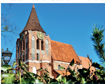
Kościół pw. Podwyższenia Krzyża Świętego

M inisterstwo Kultury i Dziedzictwa Narodowego przyznało połowę wnioskowanej kwoty na współfinansowanie remontu korpusu kościoła pw. Podwyższenia Krzyża Świętego w Pruszczu Gdańskim. Dotacja pozwoli na proceduralne uruchomienie przyznanych już dotacji Miasta Pruszcza Gdański i Marszałka Województwa.