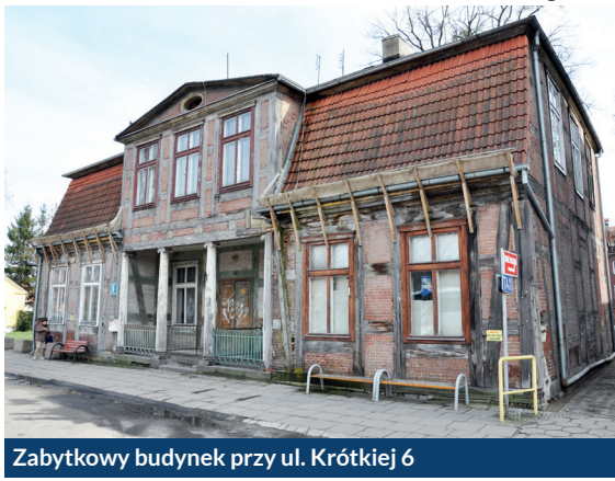
Zabytkowy budynek przy ul. Krótkiej 6

Zabytkowy budynek o konstrukcji szachulcowej wybudowany został ok. 1800 r. na wschodniej pierzei dawnego placu targowego. Na jego wyjątkowość składają się, oprócz szachulca, charakterystyczny podcień oparty na kolumnadzie, częściowe wypełnienie cegłą holenderką, oryginalna stolarka i klatka schodowa oraz wybitnie reprezentacyjny charakter, widoczny w rozkładzie pomieszczeń.