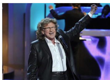
Zbigniew Wodecki