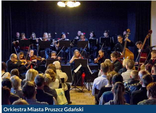
Orkiestra Miasta Pruszcz Gdański

Rady Miasta, nauczycielka języka polskiego pruszczańskiego liceum, uczennice pruszczańskiego liceum, prezesi, sekretarze, przedstawiciele przeróżnych stowarzyszeń i zrzeszeń. A ostatni koncert zapowiadała nasza pruszczańska pani listonosz. Jest to doskonała okazja uczestniczenia w wydarzeniu z innej strony, przeżycia czegoś nowego, ale również zdobycia dodatkowej wiedzy. Osoby te często mają tremę nie