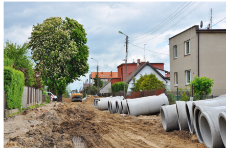
Przebudowa ulicy Kochanowskiego

Wkrótce rozpocznie się przebudowa asfaltowego boiska sportowego na terenie Zespołu