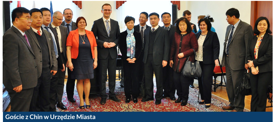
Goście z Chin w Urzędzie Miasta

Pruszcz Gdański zyskał nie tylko nowego partnera w Państwie Środka, ale także pojawiła się szansa na rozwinięcie sprawnej kooperacji handlowej, pomiędzy przedsiębiorcami obu krajów w przyszłości.