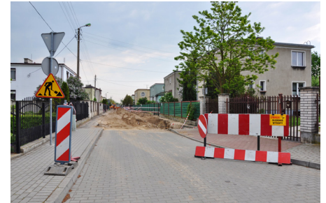
Remont ulicy Staszica i Konopnickiej

Miasto planuje już w lipcu ogłosić przetarg na remont zabytkowego budynku przy ulicy Krótkiej 6, w którym w niedalekiej przyszłości zlokalizowane będzie muzeum miasta, a także na kino w budynku Centrum Kultury i Sportu. Przy ulicy Wojska Polskiego 22/24 powstanie duży skwer, a przy ulicy Podkomorzego, do końca czerwca, nowy plac zabaw.