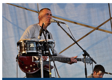
Raz dwa trzy