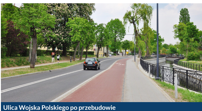
Ulica Wojska Polskiego po przebudowie

Przypomnijmy – prace podzielone były na dwa etapy. Pierwszy, od ulicy Raciborskiego do Obrońców Pokoju, dofinansowany był z Narodowego Programu Przebudowy Dróg Lokalnych – Etap II – Bezpieczeństwo – Dostępność – Rozwój oraz z Powiatu Gdańskiego. Drugi etap – od ulicy Obrońców Pokoju do ulicy Obrońców Wybrzeża, finansowany był w całości z kasy miasta.