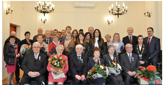
Złote Gody mieszkańców Pruszcza Gdańskiego