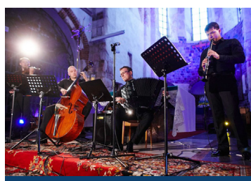
Zagan Acoustic

Dwa tygodnie po dniach miasta spotykamy się na tegorocznej Letniej Scenie. Oprócz oczekiwanego z niecierpliwością