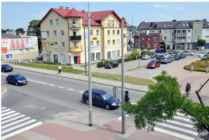
Miejsce włączenia ul. Kossaka w ul. Grunwaldzką

Ulica Grunwaldzka (na odcinku od skrzyżowania z ul. Chopina do skrzyżowania z ul. Raciborskiego), ulica Raciborskiego (na odcinku od skrzyżowania z ul. Grunwaldzką do skrzyżowania z ul. Wojska Polskiego), ulica Wojska Polskiego (na odcinku od skrzyżowania z ul. Raciborskiego do skrzyżowania z ul. Chopina) i ulica Chopina (na odcinku od skrzyżowania z ul. Wojska Polskiego do skrzyżowania z ul. Grunwaldzką) tworzą układ w kształcie wydłużonego ronda, po którym ruch odbywa się jak na zwykłym rondzie.