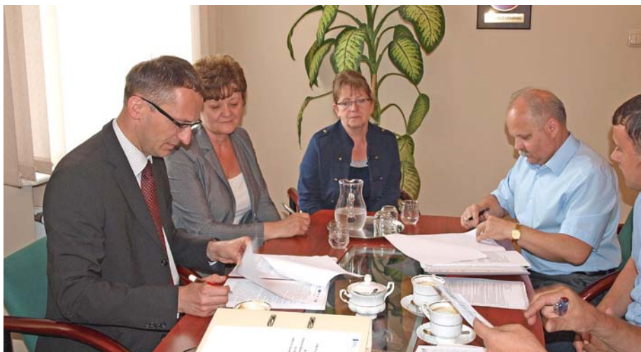
W trakcie podpisywania umowy na basen

Firma która złożyła najniższą ofertę nie przystąpiła do podpisania umowy. Gmina Miejska Pruszcz Gdański wybrała ofertę najkorzystniejszą spośród pozostałych ofert bez przeprowadzania ich ponownego badania i oceny, a wybrana oferta została sklasyfikowana jako druga w rankingu oceny ofert. Budowa basenu ma być zakończona w ciągu półtora roku.