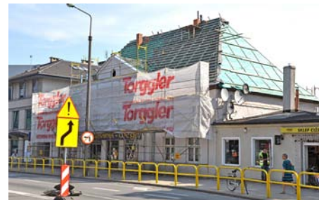
Remont budynku przy ul. Grunwaldzkiej 23

województwa pomorskiego. Dziś funkcjonuje tam popularna księgarnia.