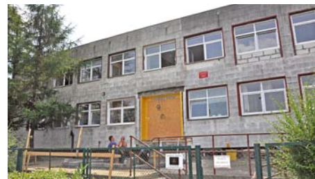
Rozbudowa obiektu przy ul. Żwirki i Wigury 8 z przeznaczeniem na żłobek

– Duże inwestycje nie zatrzymają drobniejszych zadań, poprawiających komfort życia w naszym mieście – mówi Burmistrz Janusz Wróbel. W Pruszczu Gdańskim pojawi się jeszcze w tym roku monitoring terenu rekreacyjnego przy ul. Modrzewskiego oraz punkt kamerowy na placu zabaw przy ul. Spacerowej i na placu ks. Jerzego Popiełuszki. Pojawi się tam także miejskie WiFi. Zbudujemy też ogrodzenie boiska przy „małej czwórce”. W przestrzeni miejskiej pojawią się nowe urządzenia fitness i kolejne przyrządy na placach zabaw. Rozbudujemy również alejki na nowym cmentarzu oraz zaprojektujemy, wraz z mieszkańcami, teren rekreacyjny na osiedlu Komarowo. Na rondzie przy ul. PCK pojawią się nowe nasadzenia. Umocniona zostanie też skarpa przy ul. Niepodległości. W mieście pojawią się dodatkowo dwie nowe wiaty przystankowe.