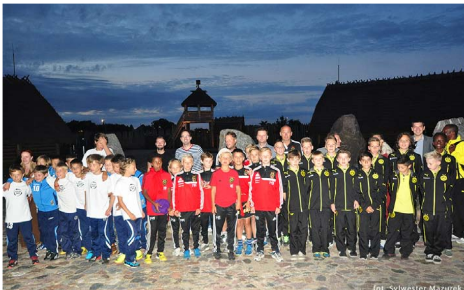
Wspólne zdjęcie młodych piłkarzy

Piłkarze Borussia Dortmund, szwedzkiego IF Brommapojkarna (słynna akademia obejmująca szkoleniem ponad 5 tysięcy młodych zawodników i zawodniczek trenujących w 250 drużynach!) oraz nieobliczalnego zespołu SDUSZOR-5 Kaliningrad podczas turnieju mieszkali