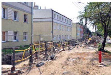
Modernizacja ul. 10 Lutego

z pewnością budowa żłobka przy ul. Żwirki i Wigury, niemniej ważne są również zbiorniki retencyjne przy ulicach: Lawendowej, Podkomorzego i Obrońców Wybrzeża. Przy okazji budowy tego ostatniego powstaną obiekty rekreacyjne oraz mała architektura. Kolejny bardzo istotny teren sportowo-rekreacyjny zostanie zbudowany przy ul. Modrzewskiego, gdzie powstanie boisko wielofunkcyjne, plac zabaw, fitness park, tor do gry w boule i górką saneczkową.