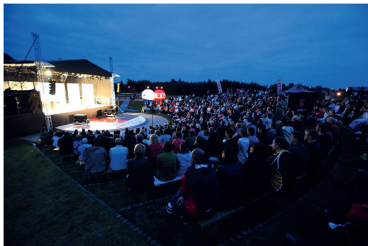
Spektakl Teatru Wybrzeże

Zespół Teatru Wybrzeże rozpocznie czwarty sezon sceny letniej premierą specjalnie przygotowaną na tą okazję pt. „Skrzynka@pandora”. Ponadto w tegoroczne wakacje aktorki Teatru Wybrzeże zagrają dla wiernej