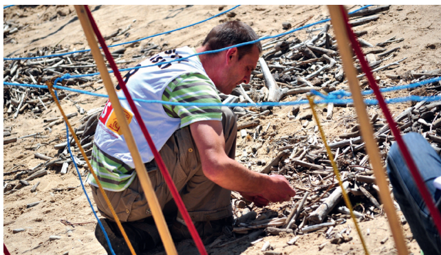
Zawody w poławianiu bursztynu

Jedną z atrakcji tegorocznych Dni Pruszcza Gdańskiego będą zawody w poławianiu bursztynu Faktoria Cup. Stanowić one będą eliminacje do XIV Mistrzostw Świata w Poławianiu Bursztynu „Jantar 2012”. Zawody polegają na tym, aby z kidziny, czyli drobnych paty-