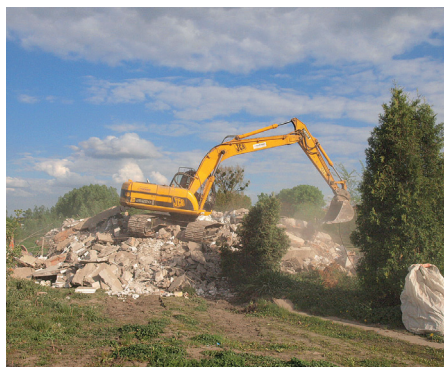
Wyburzenie budynku w centrum miasta

Z centrum Pruszcza Gdańskiego zniknęły w połowie maja dwa szpecące nasze miasto budynki. Najpierw prywatny właściciel wyburzył skorupę domu pomiędzy parkiem, nowym centrum a urzędem miasta. Tydzień później z bezpośredniego sąsiedztwa XVIII-wiecznej biblioteki zniknęła szpecąca ją budka handlowa, stojąca naprzeciwko kościoła. Koszt wyburzenia budki to 8500 zł.