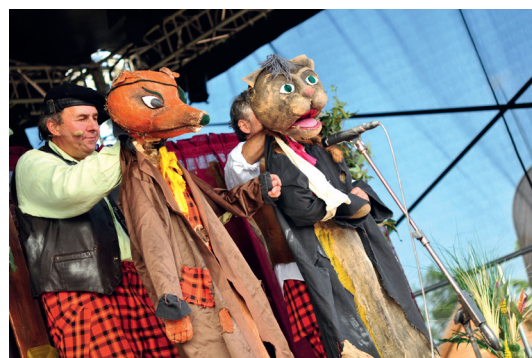
Teatrzyk dla dzieci

atmosfery występów na żywo. Niesamowity poziom artystyczny, perfekcyjne wykonanie skeczy i monologów z miejscem na błyskotliwą improwizację sprawiły, że występy przyciągają tłumy. Takie emocje czekają nas również w tym roku. Będziemy mogli