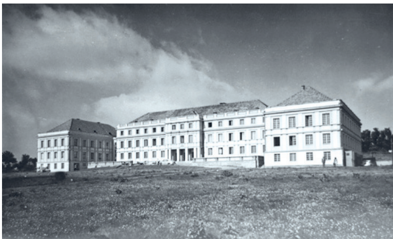
Budynek Starostwa Powiatowego w latach 50-tych

się to wydawać zadziwiające, ale układ przestrzenny, w jakim postawiono oba budynki, od początku zakładał przyszłościowe stworzenie nowej linii urbanistycznej. Jej początkiem jest dziś dworzec, końcem starostwo. Osią zaś ulica Kossaka.