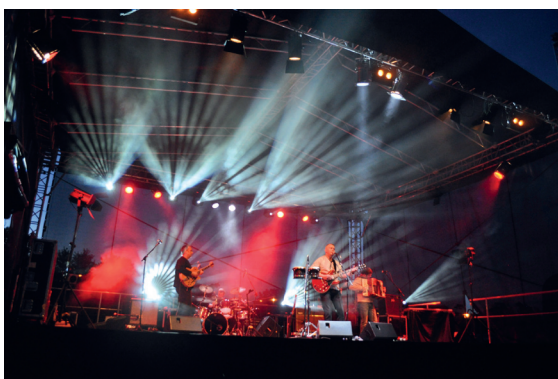
Koncert zespołu Raz Dwa Trzy podczas Faktorii Kultury 2011

bawić się na kabaretonie już 15 lipca o godz. 20, podczas którego na pewno pojawi się Piotr Bałtroczyk, Kabaret Skeczy Męczących oraz Formacja Chatelet.