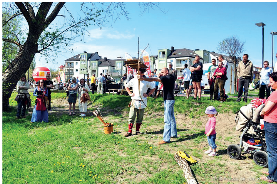
Eliminacje do Turnieju Miast

niu z łuku, rzucie „zapalką” i jeździe na rowerze stacjonarnym. Udało nam się zebrać 5-osobową drużynę składającą się z dwóch kobiet i trzech mężczyzn, którzy stawią czoła rywalom z miast partnerskich.