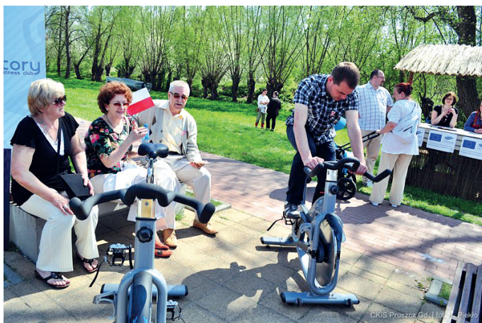
Jedna z konkurencji – jazda na rowerze stacjonarnym

11.00 prezentacją zawodników na scenie amfiteatru. Następnie reprezentanci drużyn zmierzą się w 5 konkurencjach: jeździe na rowerze stacjonarnym, poławianiu bursztynu, strzelaniu z łuku, piłowaniu kłody i rzucie „zapalką”. Konkurencją finałową, w której udział wezmą całe drużyny będzie przeciąganie liny.