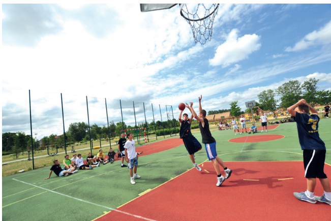
Turniej koszykówki ulicznej na Faktorii.

Turniej „Faktoria – Basket 2012” odbędzie się w dwóch kategoriach dla dziewcząt i chłopców: podstawówka i gimnazjum. Dodatkowo odbędzie się konkurs rzutów za 3 punkty. Zapisy zespołów 3-osobowych rozpoczyna się o godz. 9.00 przy boisku