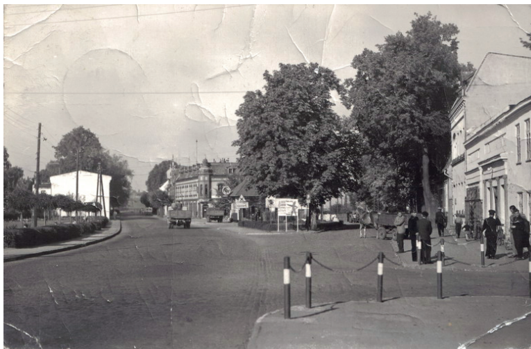
Skrzyżowanie ul. Grunwaldzkiej i ul. Chopina w 1967 r.

Kolejne ciekawe zdjęcie zapomnianego dzisiaj Pruszcza Gdańskiego, znalazło się na Wolnym Forum Gdańsk. Możemy