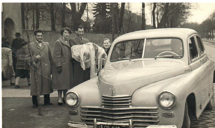
Ul. Chopina w 1957 r.