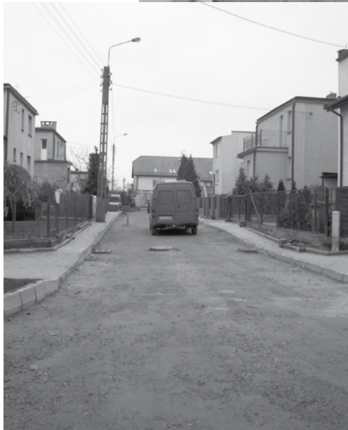
Budowa ul. Kordeckiego