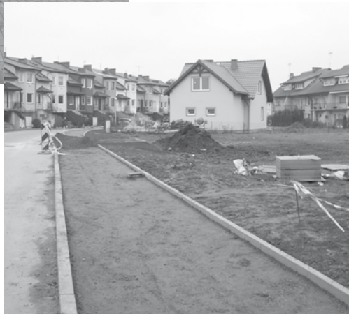
Budowa chodnika przy ul. Piastowskiej