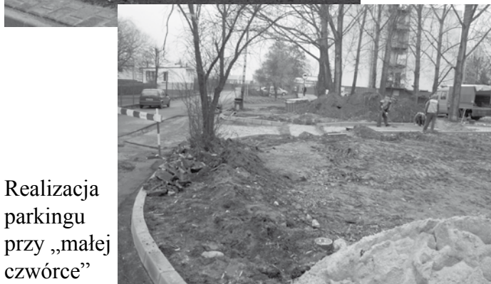
Realizacja parkingu przy „małej czwórce”