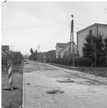
Ostatnie prace na ul. Lotniczej