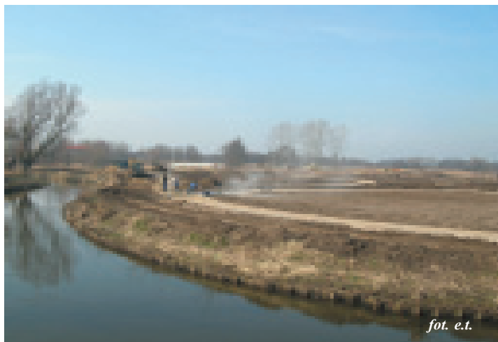
Trwa budowa Bałtyckiego Międzynarodowego Parku Kulturowego