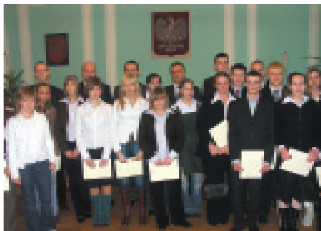
Nagrodzeni uczniowie z przedstawicielami samorządu