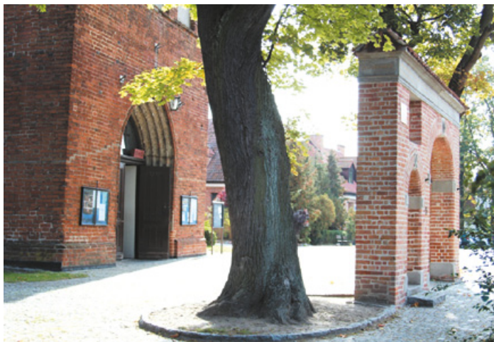
Brama cmentarna przy kościele pw. Podwyższenia Krzyża Świętego