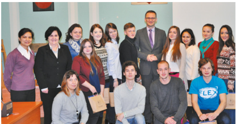
Wizyta studentów ze wschodu

Po spotkaniu młodzież miała okazję zwiedzić z przewodnikiem zrekonstruowaną Faktorię Handlową.