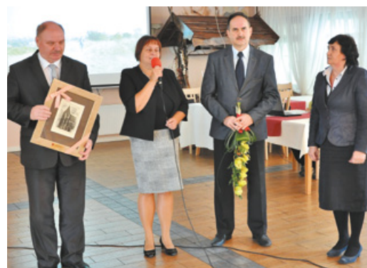
Obchody Dnia Białej Laski

Dzień ten jest okazją do przypomnienia, że w społeczeństwie funkcjonują osoby niewidome i słabowidzące, a także zwrócenia uwagi na nurtujące ich codzienne problemy.