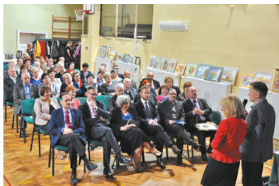
Uroczystość jubileuszowa 10-lecia istnienia Stowarzyszenia „Solidarni”