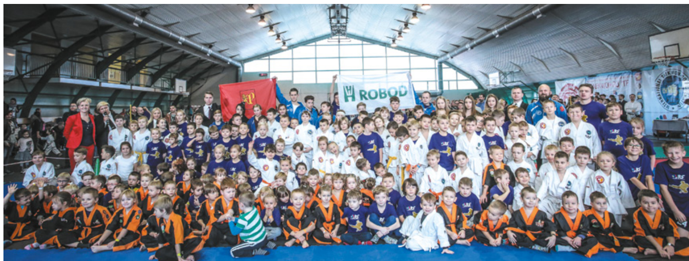
Zawodnicy rywalizujący w Mistrzostwach Województwa Pomorskiego w Taekwon-do

Pozostałe kluby w klasyfikacji to: II miejsce – Gdański Klub Taekwon-do, III miejsce – Klub Sportowy Taekwon Kolbudy, IV miejsce – Klub Sportowy Neptun Gdańsk, V miejsce – Gdyński Klub Sportowy Posejdon.