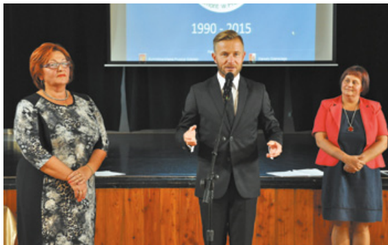
Jubileusz 25-lecia Fundacji J. Beaumont