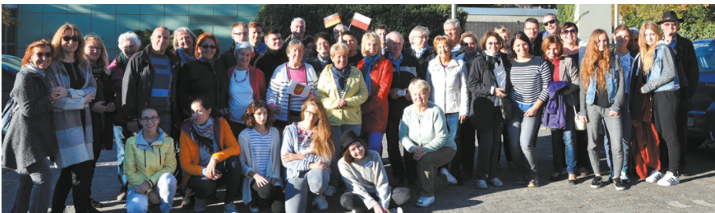
Uczestnicy spotkania partnerskiego w Hofheim am Taunus

Mieszkańcy Hofheim gościli pruszczań w swoich domach, dzięki czemu wizyta u naszego niemieckiego partnera była czasem wzajemnego poznawania się i nawiązywania relacji pomiędzy mieszkańcami obu miast. Był to też czas intensywnych działań, które przyczyniły się do przybliżenia kultury, języka i obyczajów obu narodów. W przyszłym roku z rewizytą do naszego miasta przyjedzie kilkudziesięcioosobowa grupa przedstawicieli miasta Hofheim.