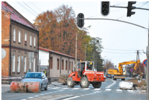
Przebudowa ul. Wojska Polskiego

Prace związane z przebudową Kanału Raduni realizowane były na odcinku od ulicy Raciborskiego do kładki dla pieszych w ciągu ul. Wojska Polskiego. Przebudowa polegała na rozebraniu istniejących umocnień i zbudowaniu nowych, remoncie przyczółków mostów i kładek. Wykonane