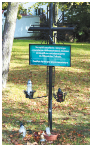
Krzyż upamiętniający cmentarz przy ul. Wita Stwosza

– Pruszcz jest jak Warszawa. To jedno wielkie cmentarzysko – mawiają niektórzy mieszkańcy naszego miasta, śledzący od dziesięcioleci prace archeologów w Pruszczu Gdańskim. Faktycznie – mające 2000 lat miejsca pochówku dawnych mieszkańców tych ziem odkrywane były na obszarze w zasadzie całego centrum mia-