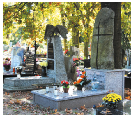
Kwaterna lotnicza na cmentarzu komunalnym

Niewielki skwerek ze szpalerem starych drzew i teren zielony, pomiędzy ulicami Wita Stwosza i Grota Roweckiego to dawny cmentarz katolicki, zlikwidowany kilkanaście lat temu. Do założenia w 1961 roku cmentarza przy ulicy Spokojnej, był to podstawowy powojenny cmentarz Pruszcza Gdańskiego. Wielu mieszkańców miasta kojarzy go jako miejsce pochówku