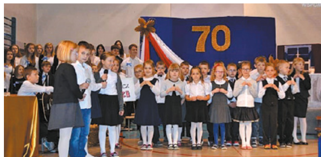
Uroczystość jubileuszowa w Zespole Szkół nr 2