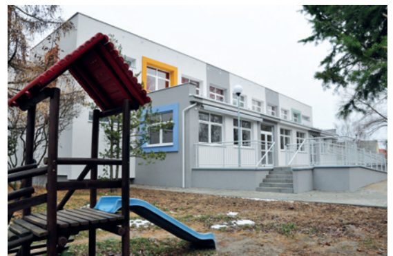
Miejski żłobek nr 1 „Króla Maciusia” w Pruszczu Gdańskim