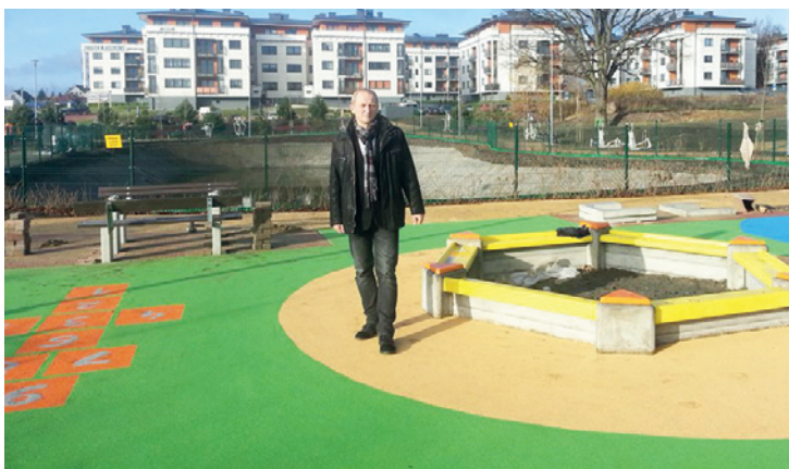
Teren biologicznie czynny i rekreacyjny przy ul. Obrońców Wybrzeża

Inwestycja ma na celu regulację wód opadowych wraz z zagospodarowaniem przyległego terenu z przeznaczeniem na plac zabaw i rekreację. Na nowym terenie rekreacyjnym wokół zbiornika zamontowano nowe urządzenia zabawowe, ławki, a także ścieżkę fitness.