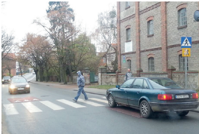
Wypowe progi zwalniające na ul. Wojska Polskiego