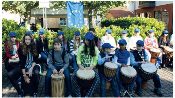
Występ grupy bębniarskiej

Tematem przewodnim wyjazdu była „Aktywność osób starszych i solidarność międzypokoleniowa”. Uczestnicy wyjazdu zwiedzili między innymi kompleks mieszkaniowy