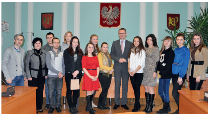
Wizyta w Urzędzie Miasta

doświadczeń w zakresie transformacji ustrojowej oraz sukcesów i porażek polskiej demokracji. Podczas pobytu i wizyt w różnych polskich miastach studenci odwiedzają ośrodki życia akademickiego, jednostki administracji samorządowej i rządowej, redakcje mediów lokalnych i zagranicznych. Spotykają się z samorządowcami, wybitnymi politykami i działaczami społecznymi, naukowcami oraz studentami polskich uczelni. Odwiedzają także ośrodki kultury i sportu.