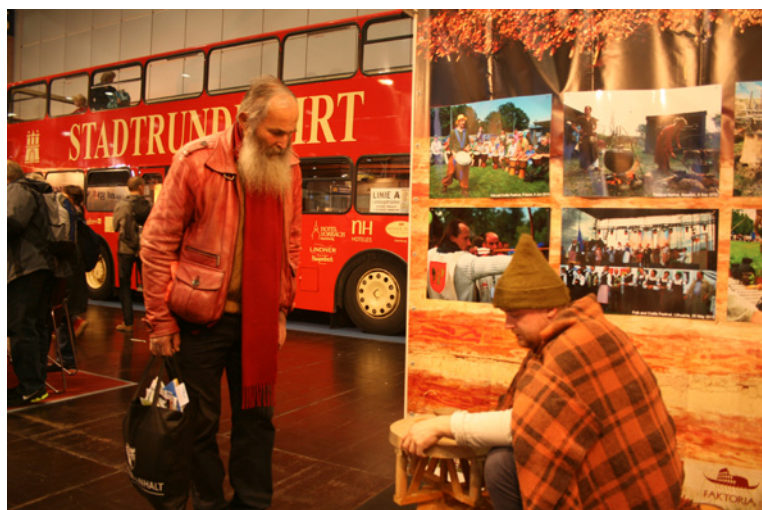
Pruszczańskie stoisko promocyjne na targach turystycznych w Lipsku