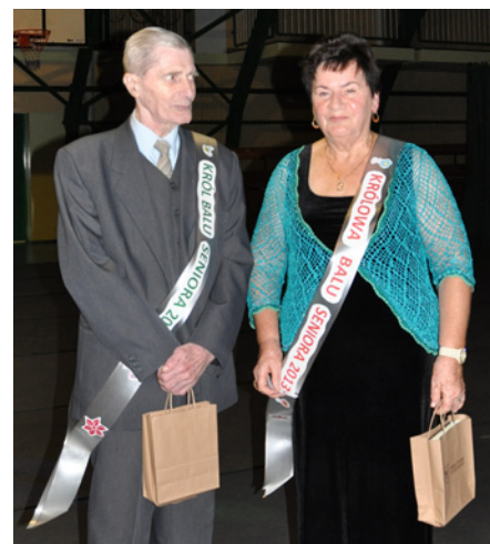
Król i Królowa Balu Seniorów

Już dziś serdecznie zapraszamy na kolejny bal za rok!