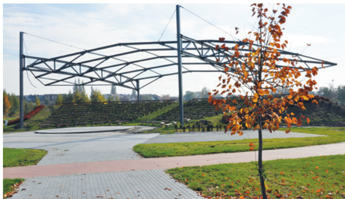
Zadaszenie amfiteatru w Międzynarodowym Bałtyckim Parku Kulturowym

Przed sezonem artystycznym wykonaliśmy instalacje podziemne i fundamenty konstrukcji namiotu. Jesień to czas stawiania stalowej konstrukcji, na której zostanie rozwieszona specjalna tkanina. Od wiosny zadaszony amfiteatr służyć będzie kolejnej edycji imprez kulturalnych, w tym VI edycji Faktorii Kultury. W tym roku, podczas piątej edycji tej imprezy, odwiedziło nas ponad 21 tysięcy osób! (BG)