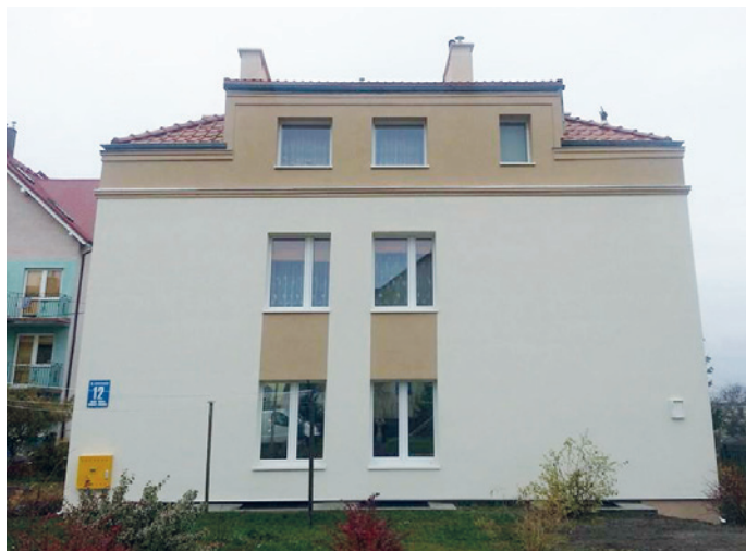
Wyremontowany budynek komunalny przy ul. Mickiewicza

Pożar zniszczył pokrycie, więźbę dachową oraz mieszkania na pierwszym piętrze i poddaszu. Po remoncie budynek posiada nie tylko nowy dach, ale także elewację, instalację gazową, stolarkę okienną. Wyremontowano także uszkodzone podczas pożaru lokale, a w mieszkaniu na poddaszu zamontowano ogrzewanie gazowe. (BG)