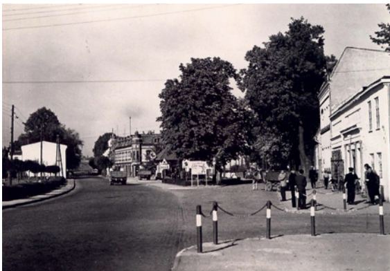
Główne skrzyżowanie w Pruszczu z 1965 roku, jeszcze bez asfaltu – położono go przed wizytą de Gaulle'a

Prowizorka trwa najdłużej. Dziś po wizycie generała została nam szybko kładziona nawierzchnia. Zostało też parę zdjęć, dziurawy pas startowy, który dziś nie przyjmie już żadnego dużego samolotu, żółte gazety i pamięć o mówiącym w Pruszczu po polsku, sławnym francuskim generale. Kto wie, może aby podtrzymać świadomość, warto nazwać też jego imieniem nowo wytyczaną ulicę na jednym z budujących się właśnie osiedli?