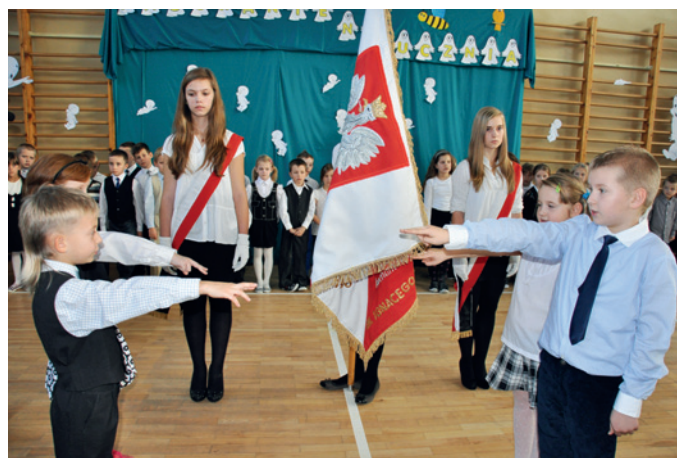
Uczniowie pierwszych klas podczas ślubowania