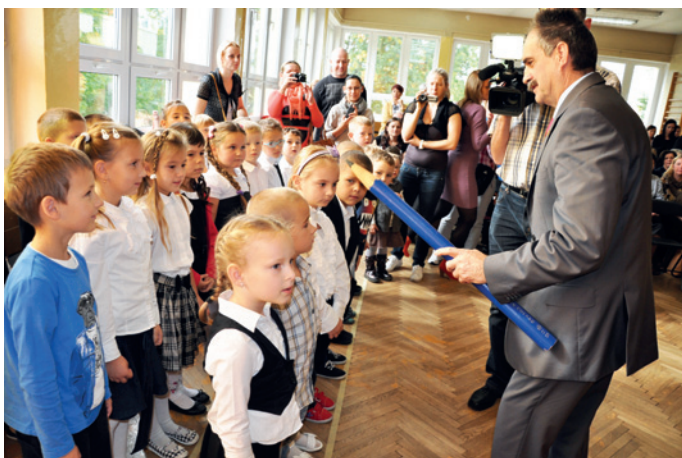
Uroczystość pasowania na ucznia w „Małej Czwórcie”

Oficjalnego pasowania uczniów dokonali przedstawiciele władz miasta oraz dyrekcja szkoły. Burmistrz życzył wszystkim uczniom wysokich stopni i niezapomnianych szkolnych chwil.