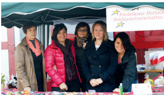
Wspólne stoisko promocyjne miast Pruszcza Gdańskiego i Stowarzyszenia na Rzecz Partnerstwa Miast w Hofheim