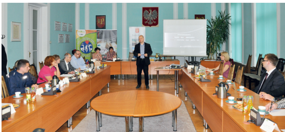
Grupa ewaluacyjna podczas prac nad audytem polityki transportowej

Dyskusje przyczyniły się do wymiany doświadczeń oraz próby zrozumienia punktu widzenia osób należących do różnych grup społecznych, zawodowych i wiekowych.