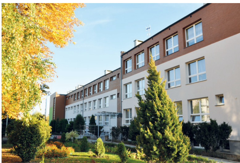
Nowa elewacja ZS nr 2

W Zespole Szkół nr 4, największej szkole w Pruszczu Gdańskim, w której uczy się 1318 uczniów, zakończono w tym roku kompleksową wymianę wszystkich okien. Obecnie na ukończeniu są też prace związane z ociepleniem ścian i wykonaniem