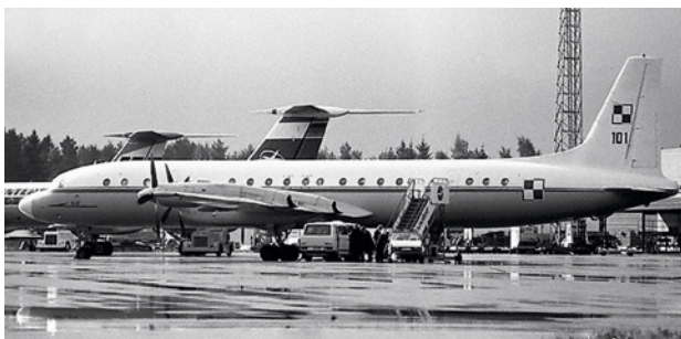
Il-18 – według Dziennika Bałtyckiego, takim samolotem przyleciał do Pruszcza Charles de Gaulle