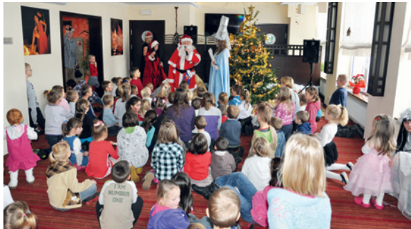
Mikołajki organizowane przez Hotel Górski