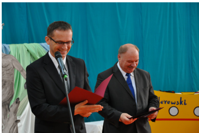
W uroczystości wzięło udział wielu gości z Burmistrzem i Przewodniczącym Rady Miasta na czele