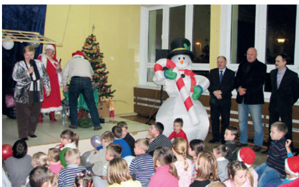
Mikołajki organizowane przez Stowarzyszenie Lokatorów Szlemka