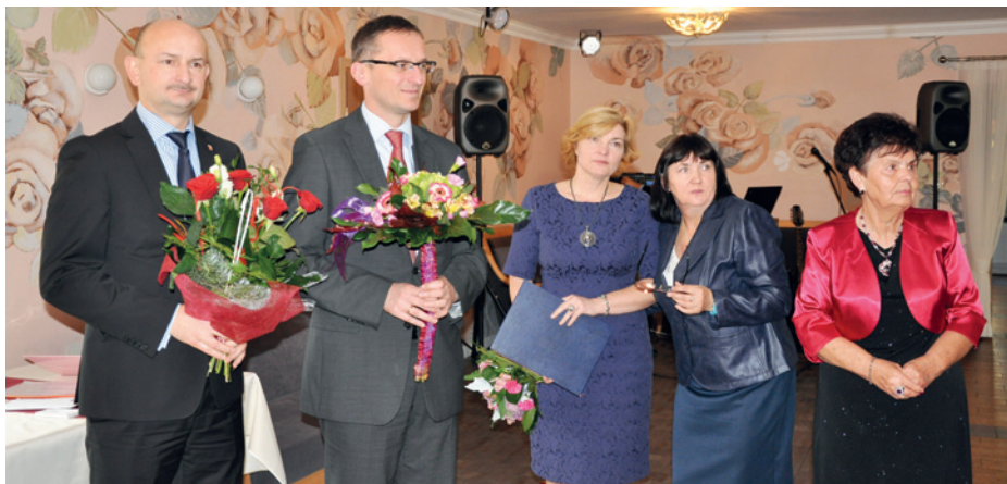
Obchody Dnia Białej Laski