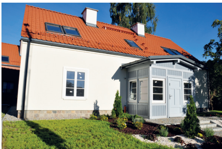
Budynek przy ul. Wojska Polskiego 52

Poprawienie funkcjonalności otoczenia budynku nastąpiło w oparciu o materiały naturalne – chodniki i opaski wykonano z kostki granitowej, wyprofilowanie terenu miało na celu stworzenie warunków do swobodnego wzrostu nasadzeń oraz łatwości pielęgnacji trawnika. Zachowano też dwa drzewa (orzech włoski). Płot wykonany został z cegły rozbiórkowej w wieku zbliżonym do remontowanego budynku, pozyskanej ze zniszczonego pożarem budynku. Sztachety wykonano z desek podłogowych zerwanych z sopockiego mieszkania. Gwoździe niestety były nowe. Dziś gruntownie wyremontowany budynek spełnia wszystkie nowoczesne normy, ozdabiając przy okazji końcowy fragment ulicy Wojska Polskiego, gdzie w idealny sposób nawiązuje do odnowionego budynku prokuratury, wpisującego się w otoczenie nowej przychodni czy nieodległej biblioteki.