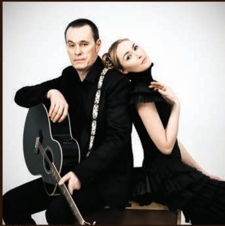
Anita Lipnicka & John Porter