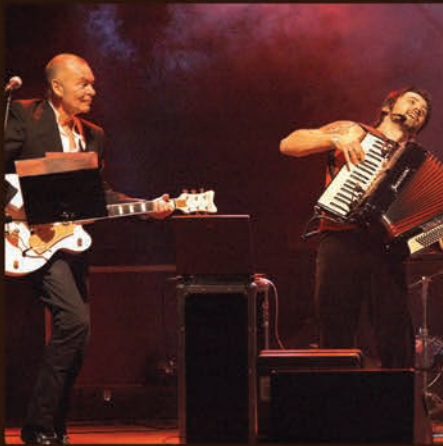
Voo Voo i Haydamaki