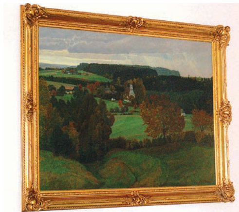
„Herbsttag im Bayerischen Wald” z powrotem w Pruszczu

Do Pruszcza Gdańskiego powrócił zabytkowy obraz „Herbsttag im Bayerischen Wald”, autorstwa Franza Turcke. Dzieło sztuki, które przez 100 lat wisiało w gabinecie dyrektora Cukrowni Pruszcz Gdański, zostało stamtąd zabrane w ubiegłym roku przez Krajową Spółkę Cukrową w Toruniu.