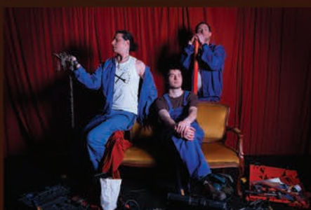
All Sounds Allowed