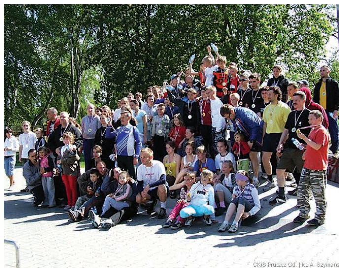
© Cj16 Pruszcz Gd. | fot. A. Szymborski